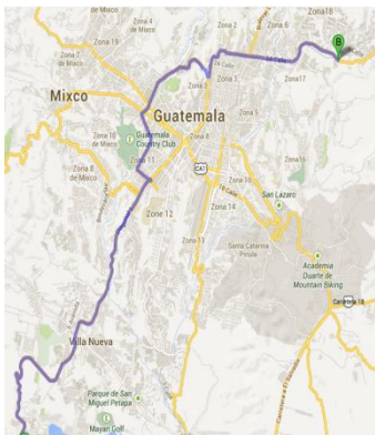
Si pasan por la ciudad capital traer mapa de la capital marcando la ruta que utilizarán.