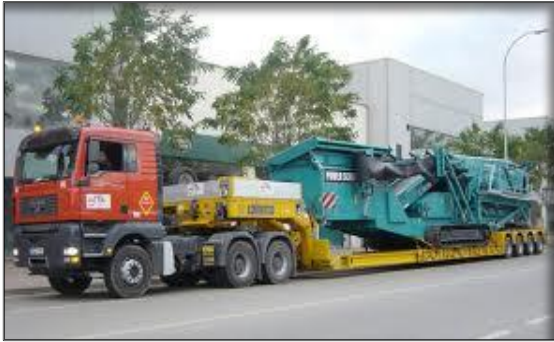
Foto real de la carga