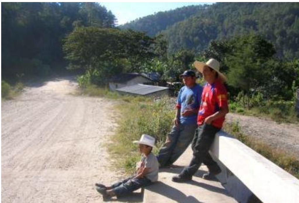
FOTO No 3: Dos viviendas ubicadas después del puente sobre el Río Quilco que serían afectadas por la carretera