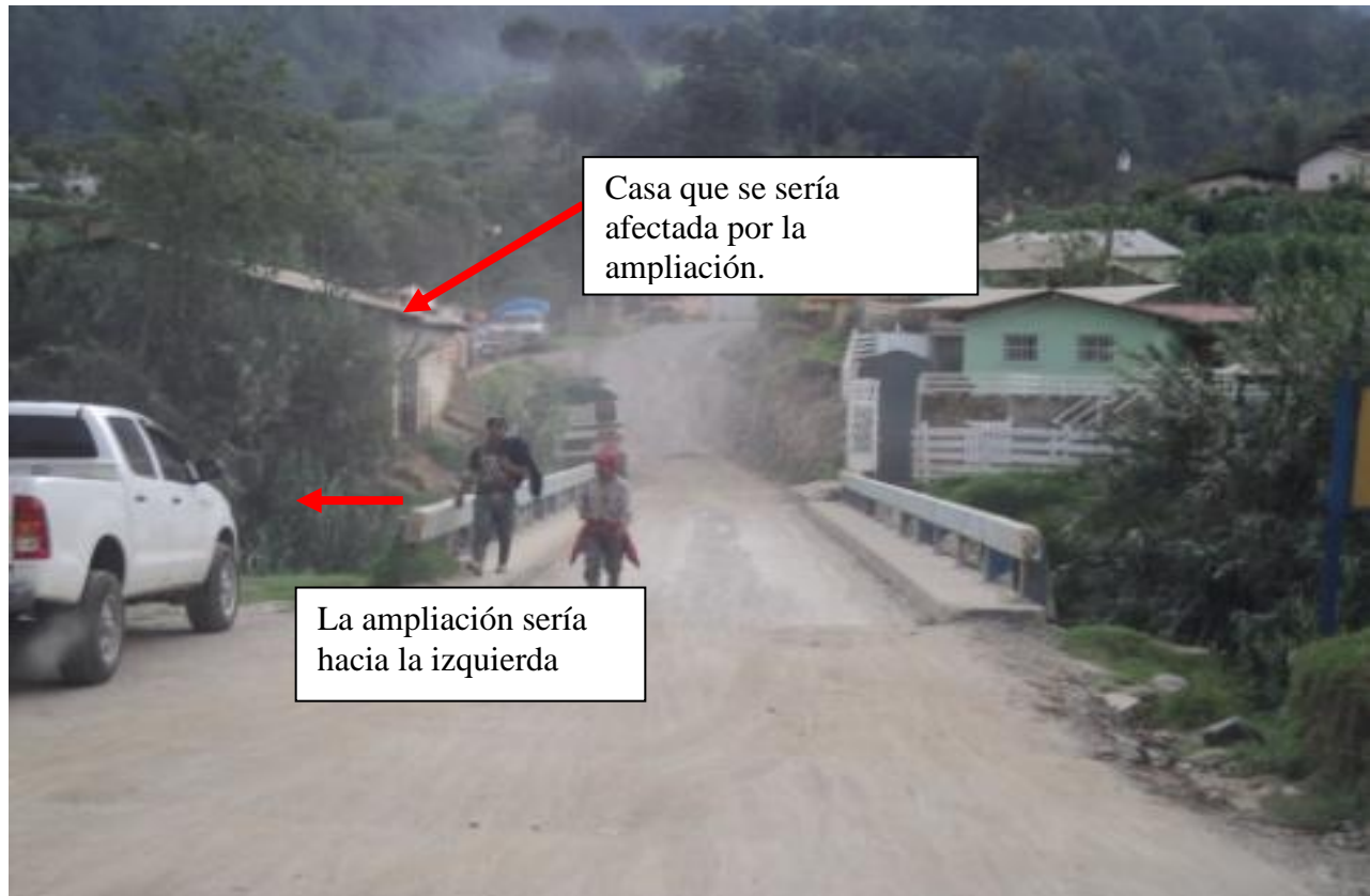
FOTO No 2: La fotografía muestra el puente EL MEMBRILLO, en la estación 0+600, y además muestra hacia donde debe de ser la ampliación del puente. A la fecha no se tiene ninguna resolución acerca de los puentes, por lo tanto si se iniciara la construcción de lo pendiente en este tramo la sección típica quedaría estrangulada en estos puntos.