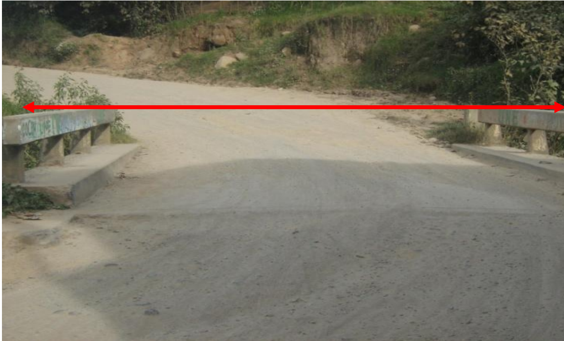
FOTO No 3: Fotografía de la bóveda LA LLORONA, en la estación 0+850, salida de Comitancillo. En este punto no se afecta a ningún vecino ya que si se autorizara la ampliación de la bóveda para que la típica modificada entre, se amplía hacia los lados, ampliando la bóveda sobre el cauce del riachuelo.