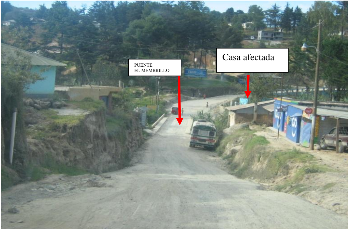
FOTO No 1: La fotografía muestra el puente EL MEMBRILLO en la estación 0+650, en la salida de Comitancillo hacia San Lorenzo. La sección típica del puente no es la misma que la sección típica de la carretera por esa razón se debe ampliar el puente en esta vista hacia la Derecha. Hasta la fecha no se tiene ningún pronunciamiento del Banco al que se le hizo la consulta en una de sus visitas con relación a la ampliación de los puentes.